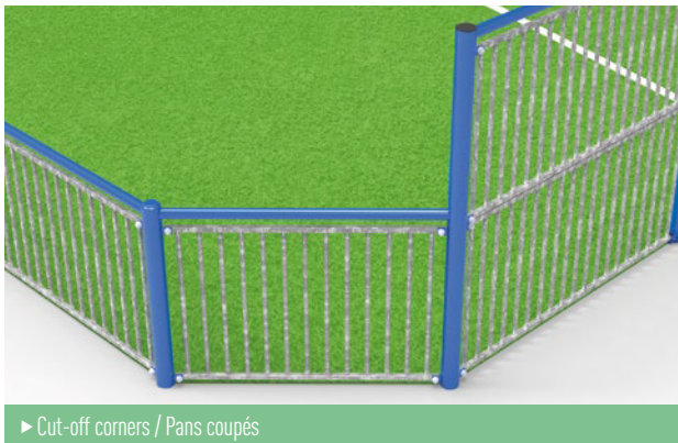
▶ Cut-off corners / Pans coupés