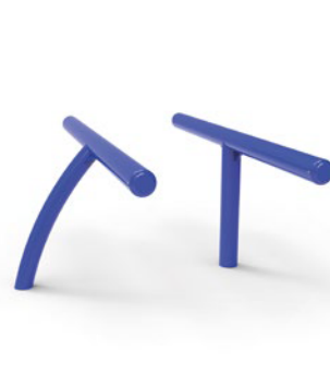
▶ Standing bench / Banc assis-debout