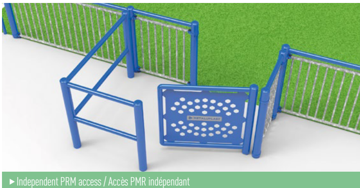
▶ Independent PMR access / Accès PMR indépendant