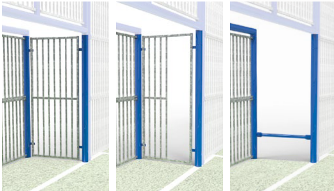
▶ Closed goal, half-open, or anti-cycle passage / But fermé, semi-ouvert, ou barrière anti-cycle