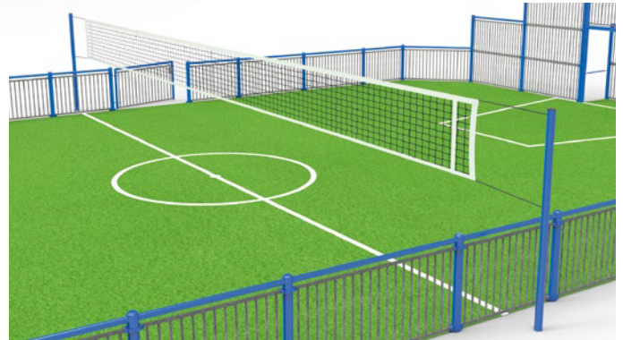
▶ Multi-sports posts: volley, tennis, badminton / Poteaux multisports : volley, tennis, badminton