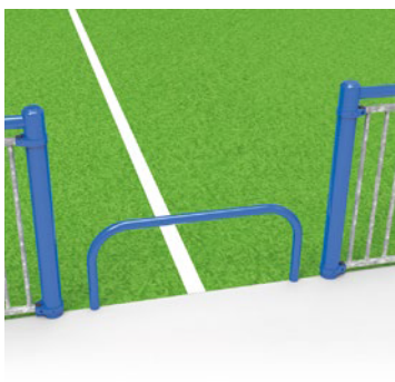
▶ Anti-cycle passage / Barrière anti-cycle