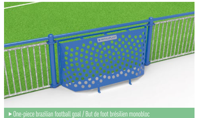
▶ One-piece brazilian football goal / But de foot brésilien monobloc