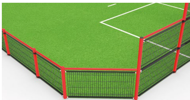
▶ Cut-off corners / Pans coupés