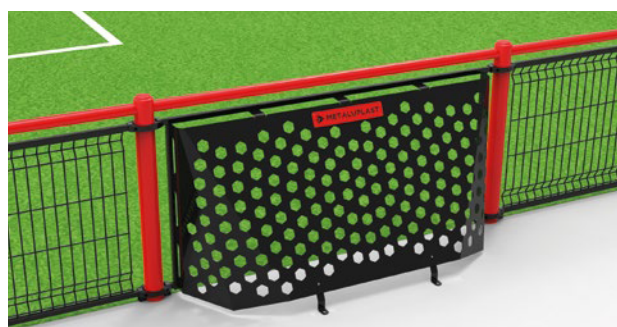
▶ One-piece brazilian football goal / But de foot brésilien monobloc