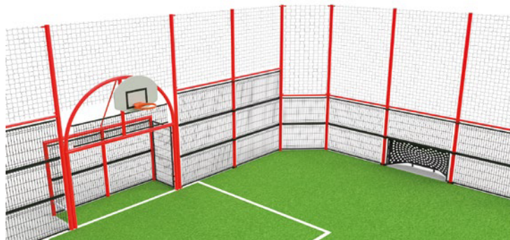
▶ Ball-stop enhancement on sides and pediments / Réhausses pare-balls sur frontons et palissades