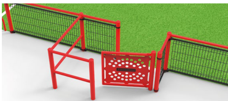
▶ Independent PMR access / Accès PMR indépendant