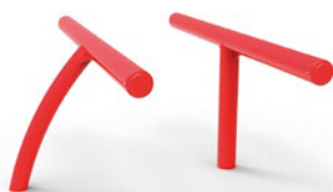
▶ Standing bench / Banc assis-debout