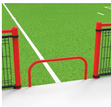
▶ Anti-cycle passage / Barrière anti-cycle