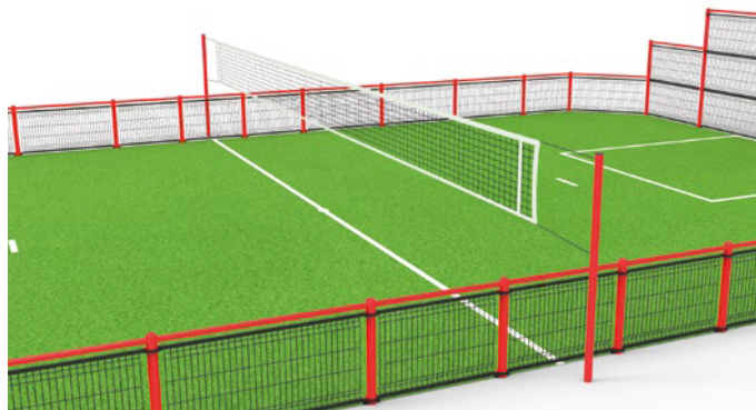
▶ Multi-sports posts: volley, tennis, badminton / Poteaux multisports : volley, tennis, badminton