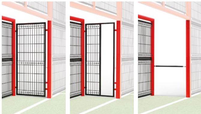
▶ Closed goal, half-open, or anti-cycle passage / But fermé, semi-ouvert, ou barrière anti-cycle