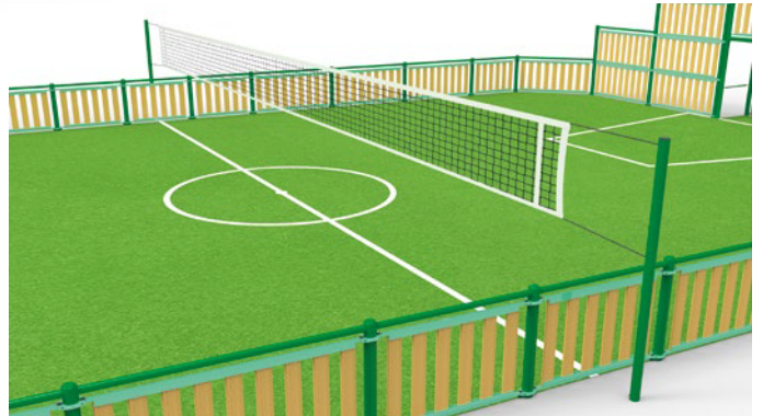
► Multi-sports posts: volley, tennis, badminton / Poteaux multisports : volley, tennis, badminton