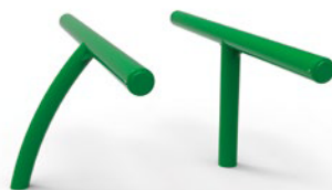
► Standing bench / Banc assis-debout