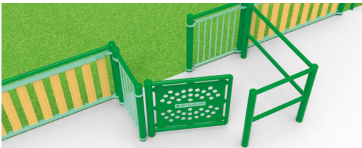
► Independent PRM access / Accès PMR indépendant