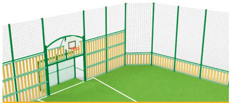
► Ball-stop enhancement on sides and pediments / Réhausseurs pare-balls sur frontons et palissades