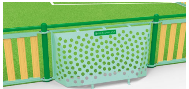
► One-piece brazilian football goal / But de foot brésilien monobloc