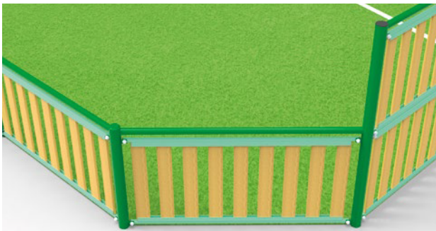
► Cut-off corners / Pans coupés