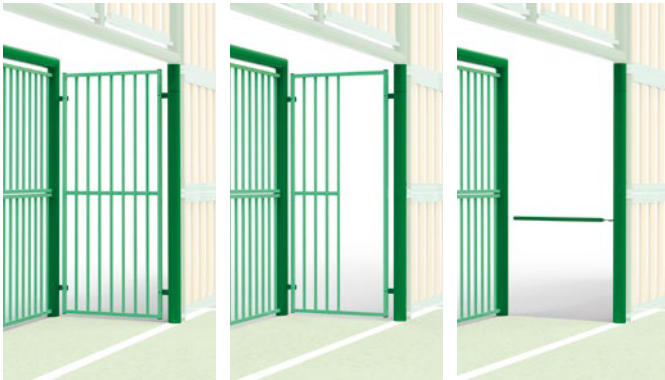
► Closed goal, half-open, or anti-cycle passage / But fermé, semi-ouvert, ou barrière anti-cycle

► REPLISSAGE PANNEAUX EN BOIS OU PVC RECYCLÉ